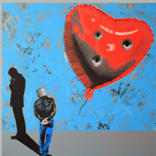
Alors by David DAVID